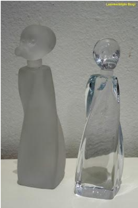
Joonas Laakso: Duckface I ja II, vapaasti muotoiltu lasi, toinen hiekkapuhallettu.