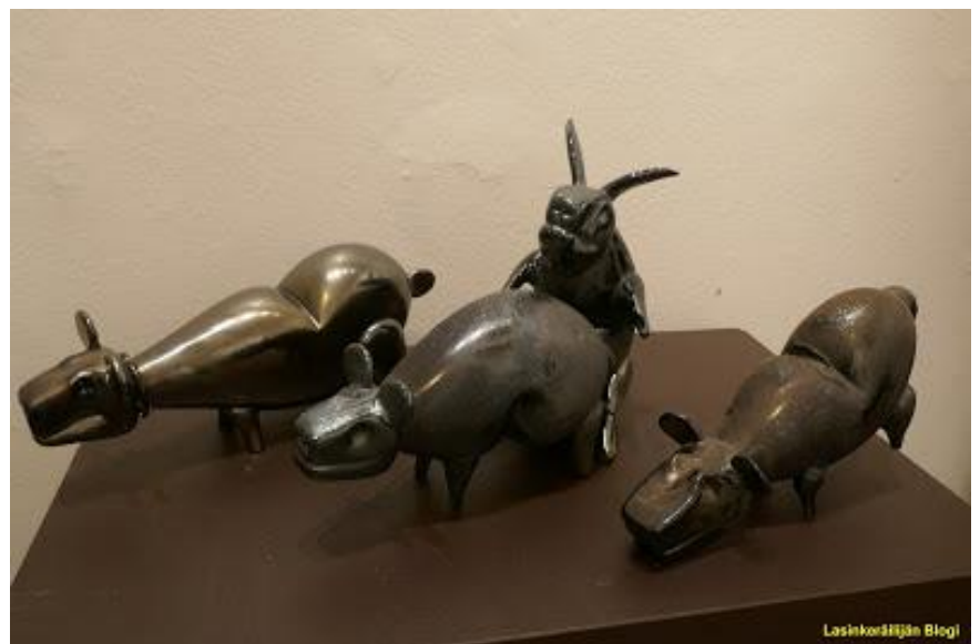
Joonas Laakso: Meläin I-IV, hyttityö.