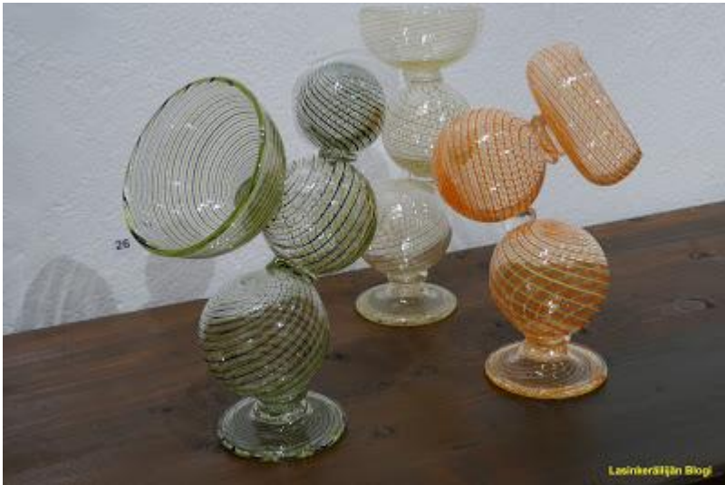
Joonas Laakso: Satellite I-III, filigraani, venetsialainen pikari