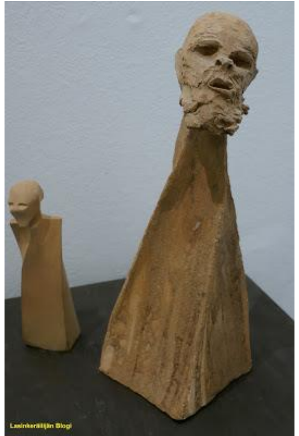
Joonas Laakso: Nimittäin ja Spede, puupoltettu keramiikka, 2006.