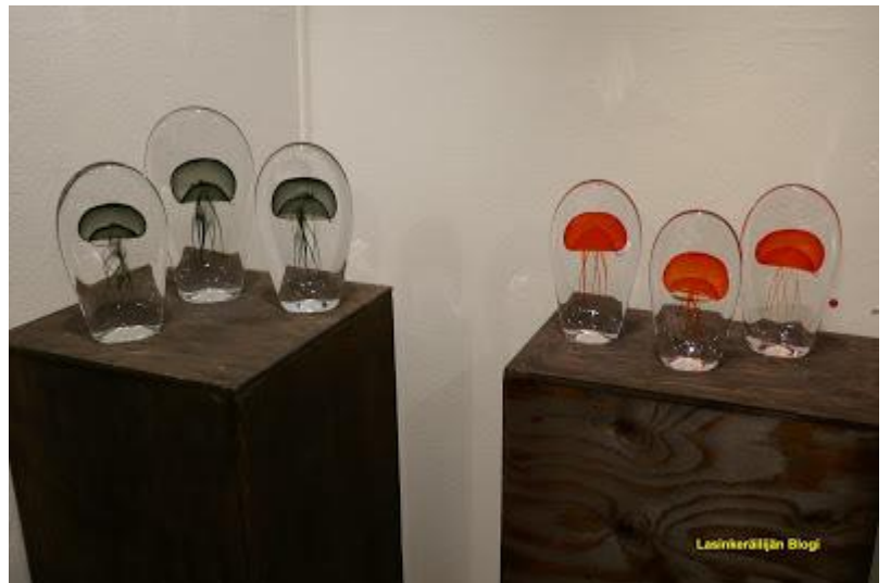
Joonas Laakso: Meduusa I-VI, vapaasti muotoiltu, hiottu, kiillotettu lasi.