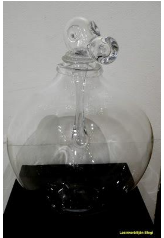
Joonas Laakso: useita versiota teemasta CCCPGP5, vapaasti puhallettu, liimattu lasi