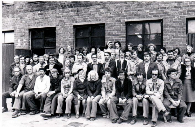
Oy Kumelan henkilöstö 1977

Oy Kumela tunnetaan erityisesti maalatusta lasistaan. Toimintansa vuonna 1937 aloittanut tehdas joutui taloudellisiin vaikeuksiin 1970-luvun lopulla, ja vuonna 1976 Kumelan suku joutui myymään tehtaansa ylivoimaisten vaikeuksien vuoksi.