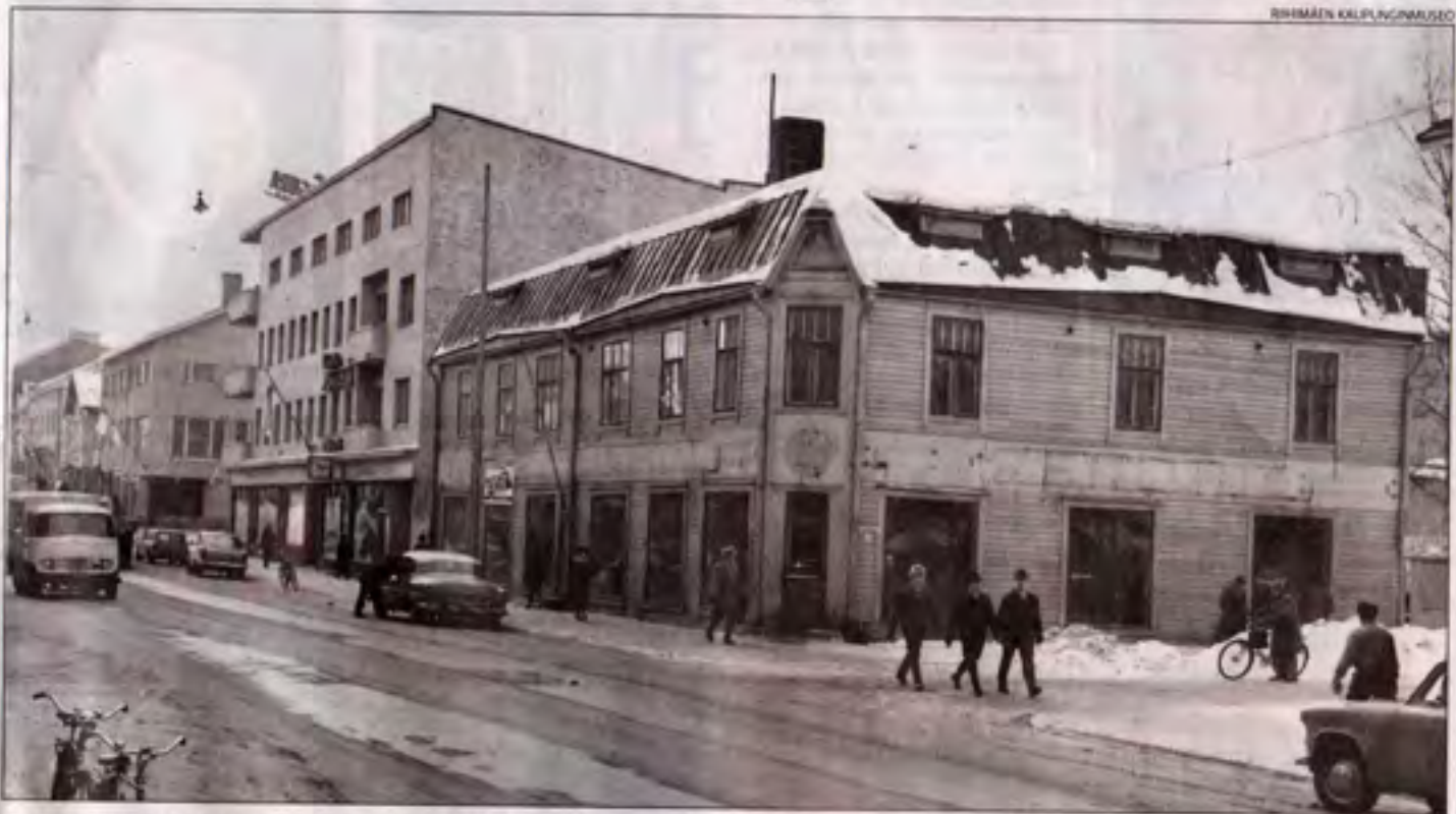
Vanhaa Riihimäkeä. Kuva on otettu Hämeenkadun ja Kauppakujan risteyksestä maaliskuussa 1963.