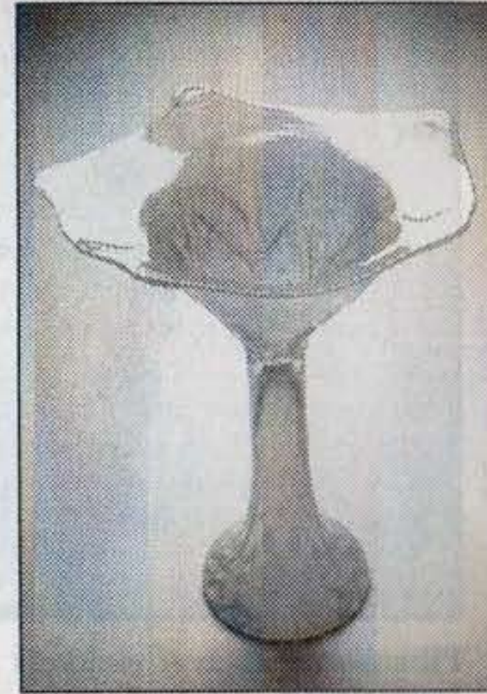
Lola -rypäle kulho.

Puhaltajankatu 46:ssa. Saksan näyttely kestää heinäkuun loppuun, ja sillä aikaa galleriassa on