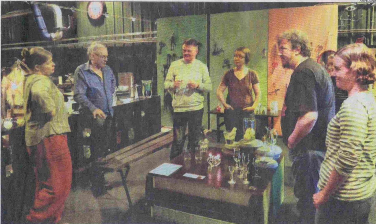
Verstakon lasistudiossa oli tiivis tunnelma, kun Isoverin työporukka opetteli uutta taitoa.

Meillä oli tosi hyvät opettajat. Ilman heitä ei töistä olisi tullut mitään.